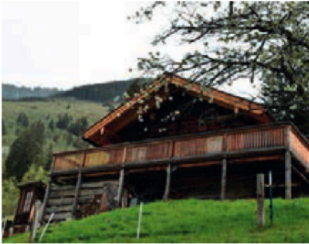
Die gemütliche Hütte im Fuschertal befindet sich auf zirka 900 Höhenmetern und soll demnächst ein Erlebnisort für Groß und Klein werden.